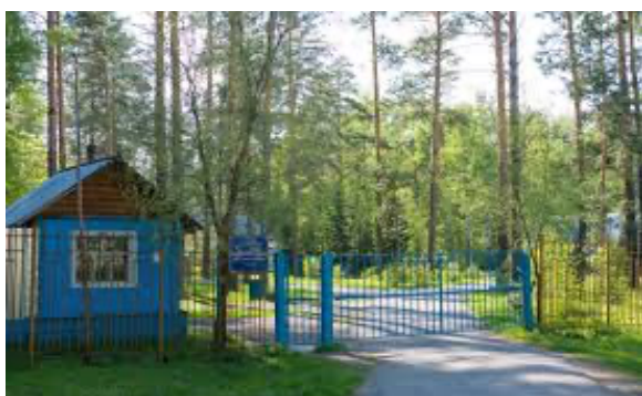
Вход на территорию Южно-Сибирского ботанического сада