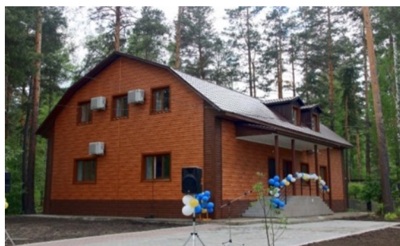
Учебный корпус 1